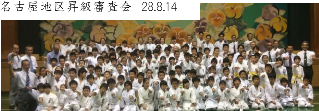
名古屋地区昇級審査会 28.8.14

第4木曜日午前5時~6時半。 平成9年6月26日に始めた 「さやか空手研究会」 8/25 に 220 回目のけい古、 「大学の素読」「基本稽古」「棍 の一二基本」でさわやかな汗。 物に本末あり。事に終始あり、 前後するところを知ればすな わち道に近し。 指導者として根っこに栄養を 与え続けています。