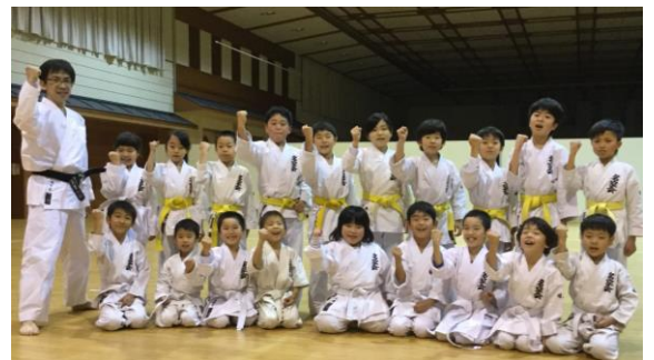
武道館で基礎コースと少年部初級と合同けい古 12.22 (木)