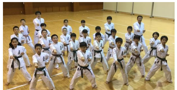
少年部は1,000本突きに挑戦 大垣市武道館 12.22 (木)