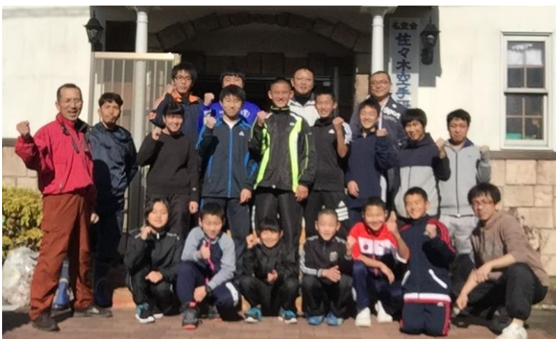
大掃除で道場はピッカピカ ありがとう！ 手伝ってくれた皆さん 28.12.25 (日) 8時