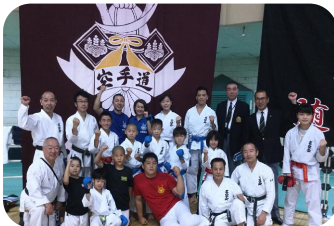
第53回和道会全国大会 29.8.19-20 日本武道館