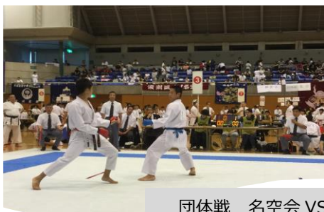
団体戦 名空会 VS 東京大学 次鋒：隼人選手 4-0で勝ち