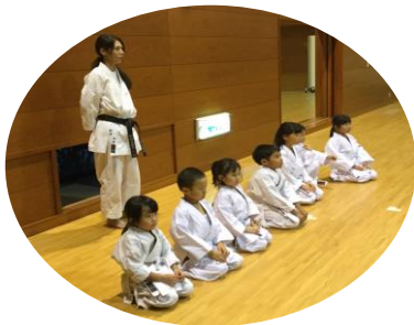
武道館けい古 30.9.28 大垣市武道館