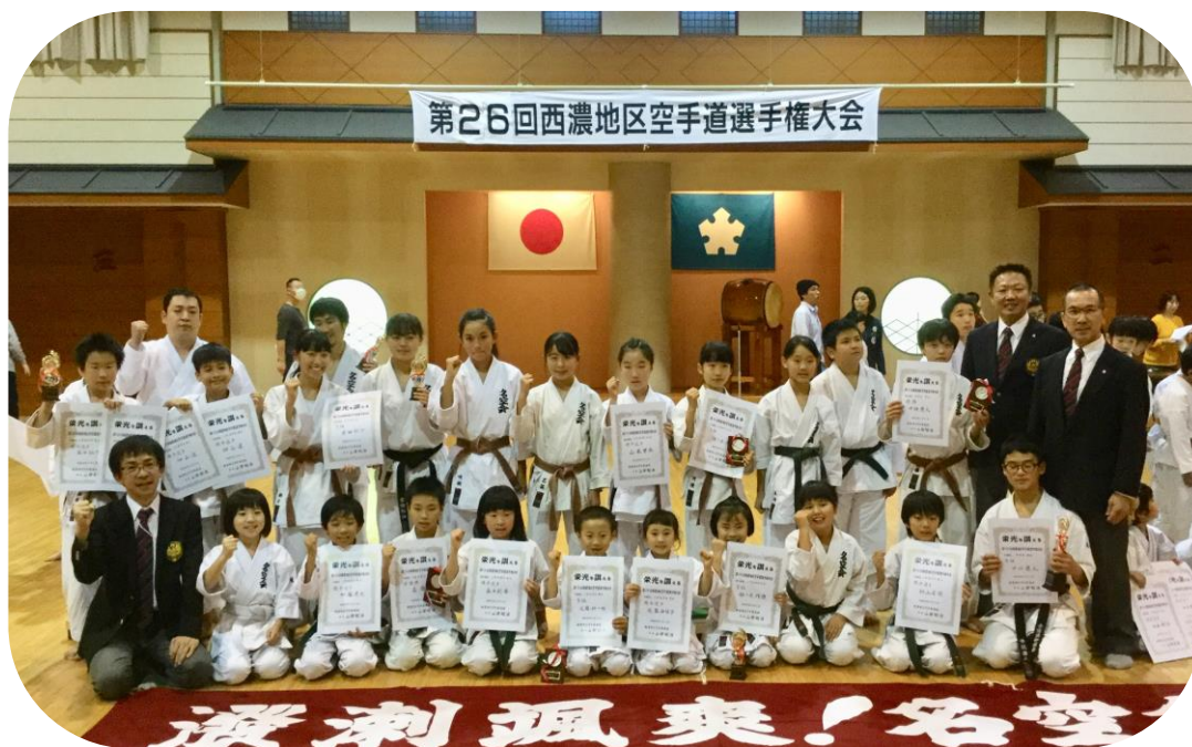
西濃地区空手道大会 30.11.11 大垣市武道館 名空会の選手が活躍しました

月曜日が振替休日の場合、火曜日に「振替けい古」を行います。 【フレックスタイムけい古】 5:00~6:30、6:00~7:30、6:30~7:30 など 5:00 から 7:30 までの時間内、好きな時間にけい古ができます 12/25(火)から実施しますのでけい古に来てください。